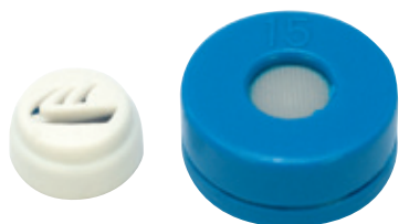
Comparaison entre un filtre DM et un filtre Elacin ER